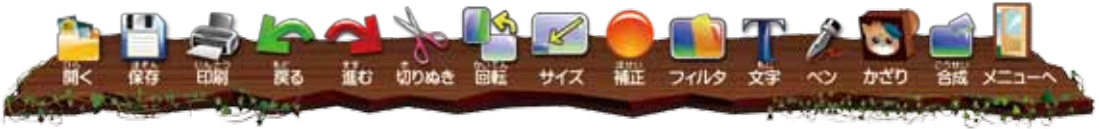
ツールバーのボタン名 / 機能